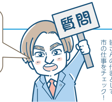
皆さんの代表として 市の仕事をチェック!

小中学校の給食費の無償化に踏み出すべきです! 点字ブロックが壊れています! 修繕工事はどうなっていますか? どうですか?!市長!