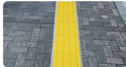
昭島駅南口~あいぼくの区間で 75%の補修が完了