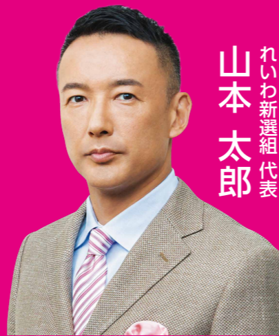
れいわ新選組代表 山本 太郎

上がった物価を下げる、政治の責任です。毎日が10%オフ! 消費税は廃止で景気回復へ。零細事業者などからも消費税を搾り取るインボイス制度はもちろん廃止。